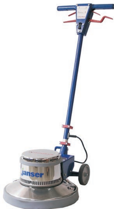
Columbus Mod. 135 SH 1.200 Watt