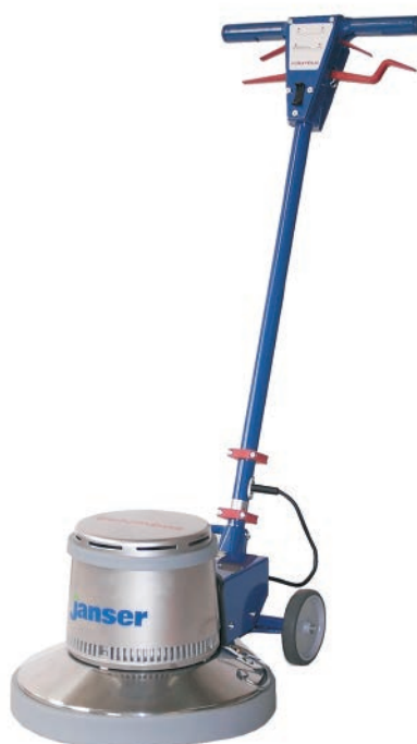
Columbus Mod. 145 SH 1.500 Watt