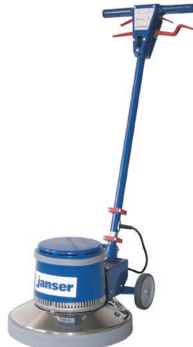
Columbus Mod. 155 S 2.000 Watt