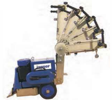
Posizioni di lavoro