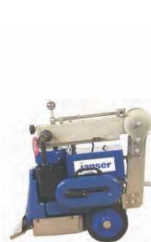
Posizione di trasporto